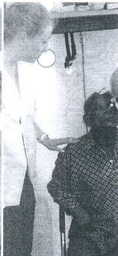
Arriba, los trabajadores del hospital en la puerta del centro médico. Sobre estas líneas, un ingreso urgente y, a la derecha, revisión oftalmológica aprovechando la visita de un médico voluntario. [10/10]

MEDIOS ■ La escasez de medios hace que la improvisación sea el pan de cada día